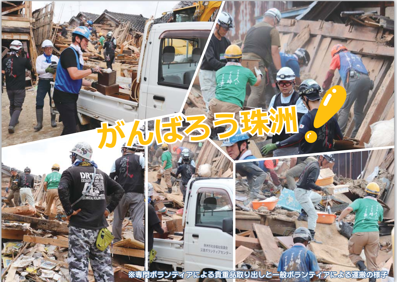
※専門ボランティアによる貴重品取り出しと一般ボランティアによる運搬の様子